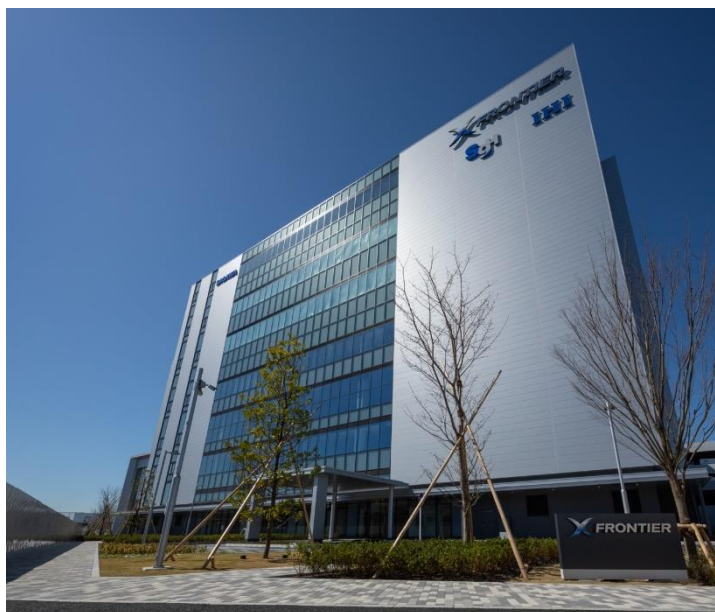
X フロンティア外観（東京都・江東区）

SGH グローバル・ジャパンと菜鸟は、これからも海外進出するお客さまへの最適な国際物流ソリューションを提供してまいります。